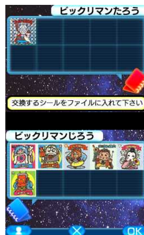
交換レート設定も自由に可能