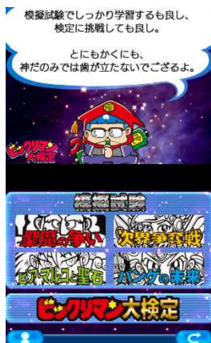
知識を試す 3000 問の大検定