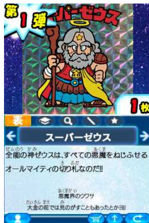
シールの表面はもちろん、裏面とプロフィールテキストも完全再現