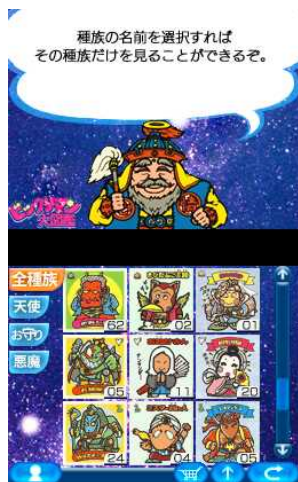
天使、悪魔、お守りの三すくみ