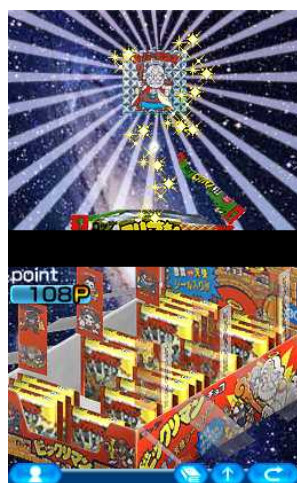
チョコ購入はリアリティを追及